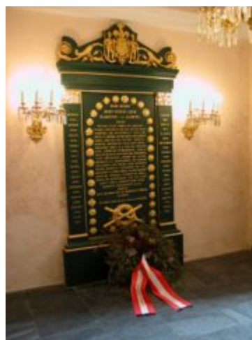
Obr. 9 Radeckého hrob na Heldenbergu (Wikipedia 2011b).

Aktivně se účastnil napoleonských válek. Roku 1805 byl odvelen do Itálie, kde v hodnosti generálmajora velel třetímu kyrysnickému pluku, po bitvě u Wagramu (1809) byl jmenován šéfem generálního štábu, podílel se na plánování bitvy u Lipska (1813). V následujících letech působil ve vrchním velení rakouské armády. V době míru působil jako divizní velitel ( Divisionär ) v Ödenburgu, Budapešti a od roku 1821 jako velitel pevnosti ( Festungskommandant ) v Olomouci. V letech 1831 – 1857 byl jmenován vrchním velitelem rakouské armády v Lombardsko-benátském království ( Lombardo-venezianischen Königreich ) – roku 1836 byl povýšen do hodnosti polního maršála ( Feldmarschall ).