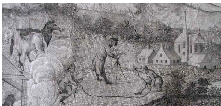
Obr. 5 Detail zeměměřičů na mapě Galicie a Lodomerie od J. Liesganiga, (Liesganig 1780).

Informace čerpány z: (Nischer 1925: 76 – 80).