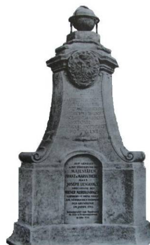
Obr. 4 Monument na severním konci Liesganigovy základny u Vídeňského Nového Města vybudované roku 1762 (Hofstätter 1989: 23).