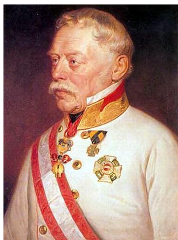
Obr. 8 Johann Joseph Wenzel Anton Franz Karl Graf Radetzky von Radetz (Jan Josef Václav hrabě Radecký z Radče).

Roku 1784 byl odveden a nastoupil službu jako kadet u 2. kyrysnického pluku 4 (2. Kürassierregiment ). V letech 1788 – 1789 se účastnil války s Tureckem, 1792 – 1795 vojenských tažení v Nizozemí a na Rýnu. V následujících letech byl několikrát povýšen do hodnosti: setník ( Rittmeister ), major ( Major ) a roku 1799 plukovník ( Oberst ), generál major ( Generalmajor ), „podmaršál“ ( Feldmarschallleutnant ).