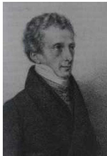
Obr. 3 Ludwing August Freiherr von Fallon (Nischer 1925: 136).

Informace čerpány z: (Nischer 1925: 136 – 143).