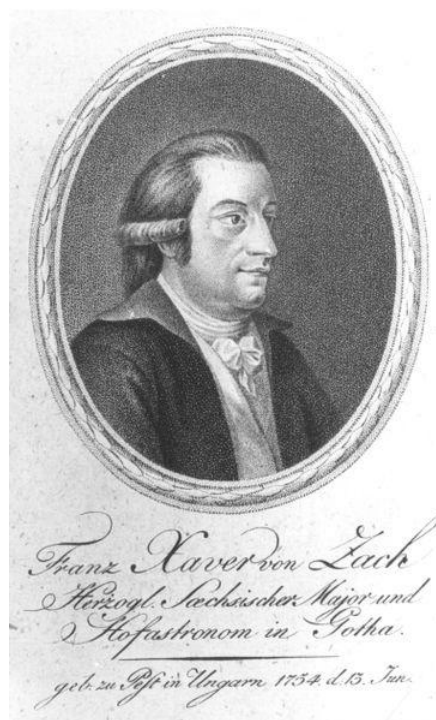
Obr. 10 Franz Xaver Freiherr von Zach (Wikipedia 2011c).

V roce 1820 byl povýšen do hodnosti generálmajora ( Generalmajor ). V následujících letech cestoval po Švýcarsku. Roku 1827 odcestoval do Paříže, kde podlehl tamní epidemii cholery a 2. září 1832 zemřel.