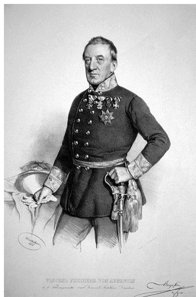
Obr. 1 Vinzenz Freiherr von Augustin (Wikipedia 2011a).

Informace čerpány z: (Nischer 1925: 130 – 133).