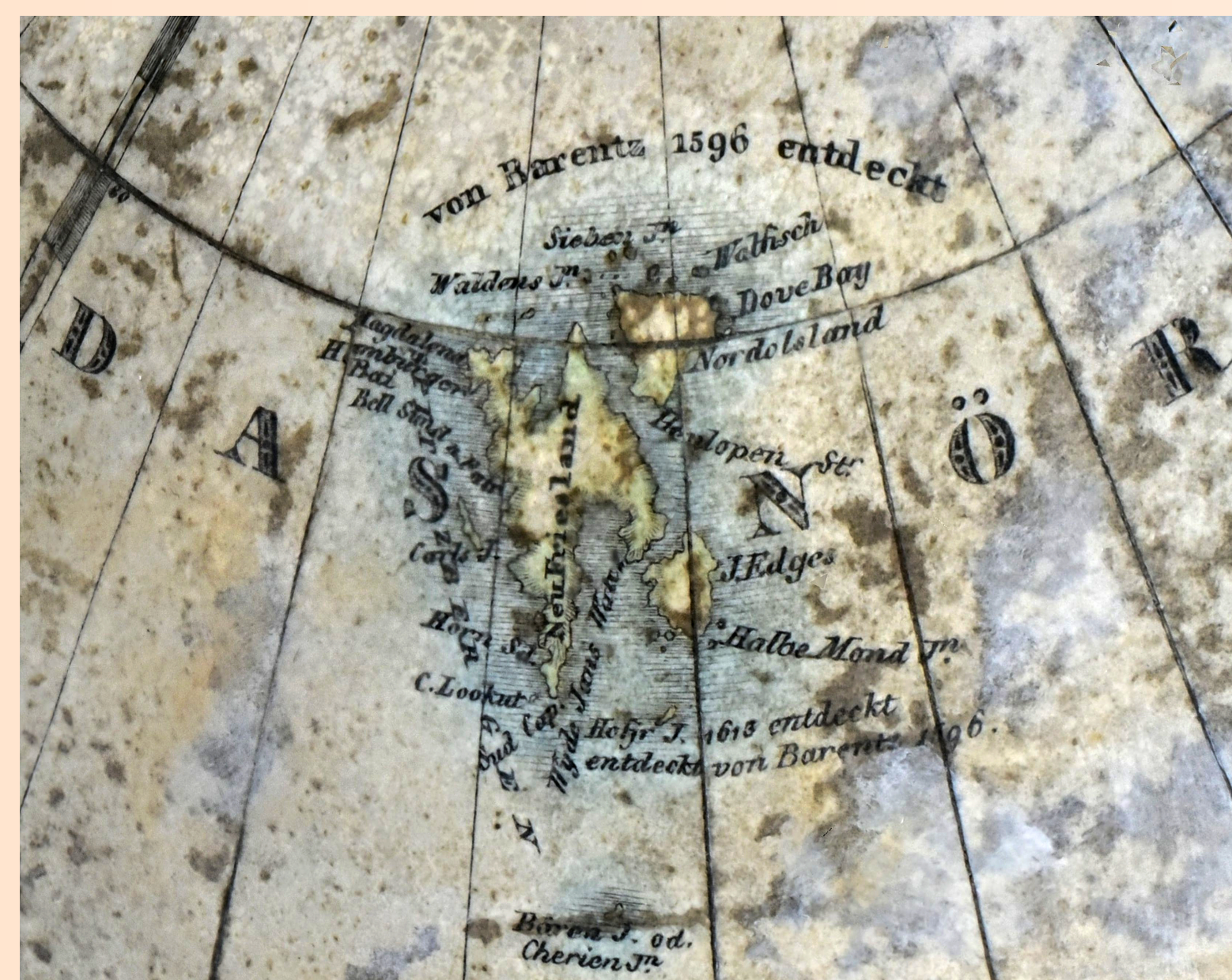
Obr. 3: Příklad zápisu zeměpisného objevu „von Barentz 1596 entdeckt“

von Barentz 1596 entdeckt (obr. 3), Neu Seeland von Abel Tasman entdeckt 1642, Neu Georgie. Entdeckt von Roche 1675, wieder aufgesucht von Cook 1775 u. Bellingshausen 1819.