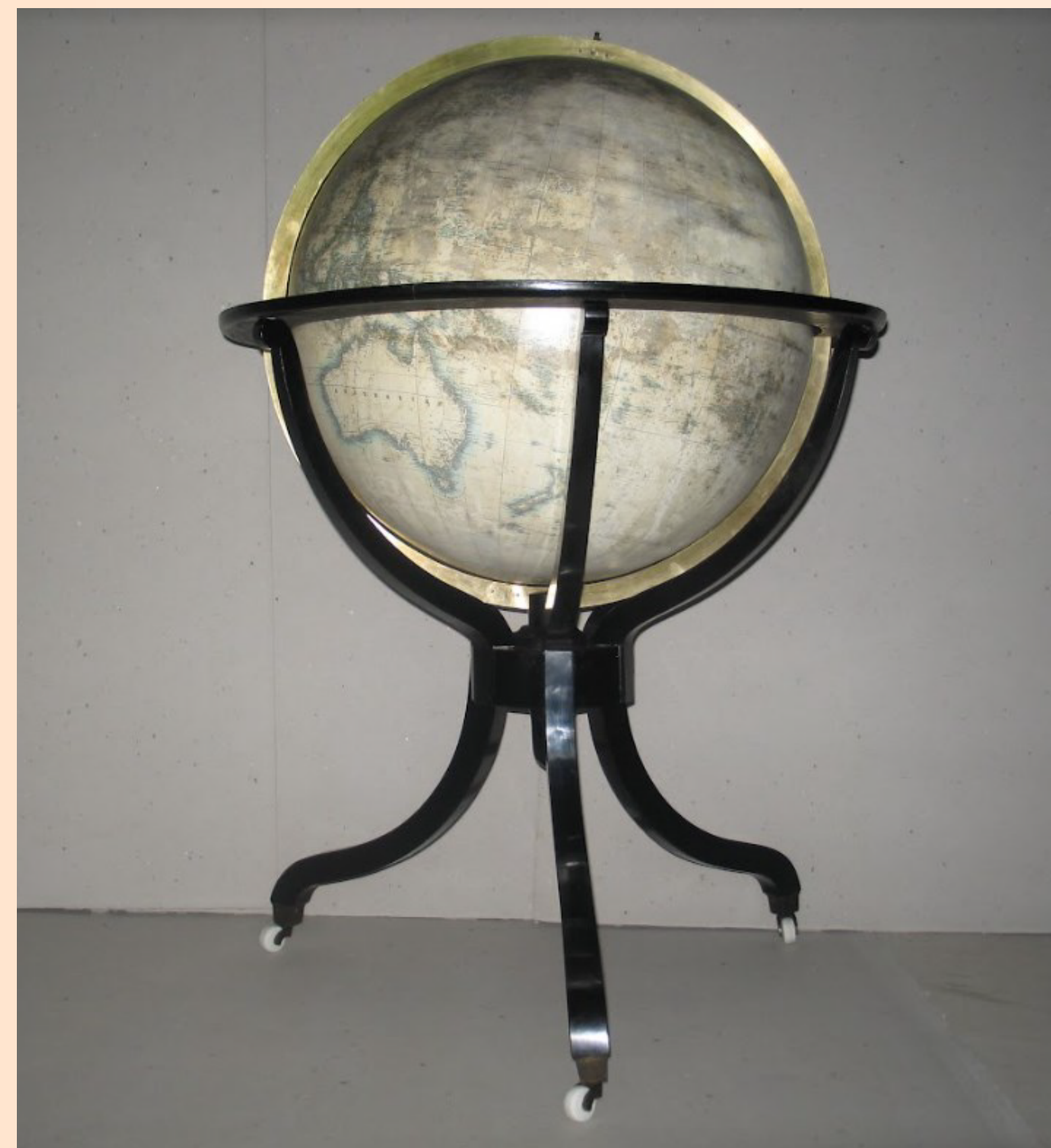
Obr. 1: Restaurovaný Jüttnerův glób z fondu Mapové sbírky PŘF UK

2 Mapová sbírka, Přírodovědecká fakulta, Univerzita Karlova