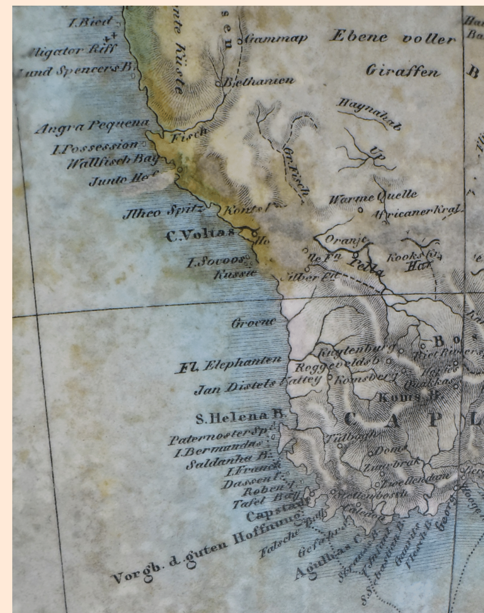
Obr. 4: Území Neznámé země

Zemský glóbus nazvaný Erdkugel o průměru 62,4 cm, obvodu 165 cm a výšce okolo 115 cm je datován rokem 1839 (obr. 1). Je vytvořen v měřítku 1 : 21 000 000. Josef Jüttner vydal dílo ve Vídni. Jako rytci jsou uvedeni Bernhard Bitter a Johann David, vídeňský rytec. Glóbová koule je sádrová, polepená papírovými glóbovými dílky. Stojanem je dřevěná lakovaná trojnožka na kolečkách. Zeměkouli obepíná mosazný poledníkový kruh s vyrytou stupnicí. Vybavení doplňuje vertikální dřevěný kruh s kalendářem a znameními zvěrokruhu. Glóbus byl restaurován v roce 2016 Miroslavem Širokým.