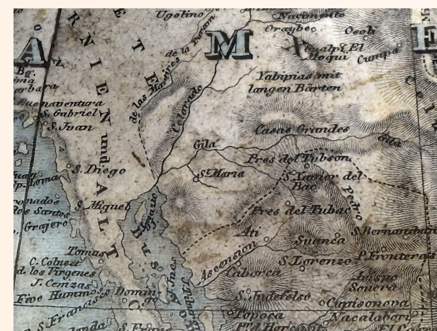
Obr. 5: Ukázka hraničních přerušovaných čar

Toponyma v Evropě (obr. 6) jsou tak přesycená, že jsou téměř nečitelná. Autor evidentně směřoval k úplnosti.