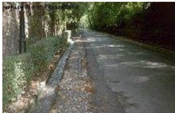
Obrázek 3: Cesta k Alhambře

Umístění v krajině můžeme nazvat jako jedno z výjimečných krás přírody. Náhorní plošina sama o sobě diktuje široký rozhled na město a planiny Granady východním a jižním směrem. Maurští básníci Alhambru přirovnávají k „perle vsazené do smaragdu“ v narážce na barvy budov a lesy kolem. Park (Alameda de la Alhambra), na jaře překypující bujnou flórou a trávami, byl za Maurů osazen růžemi, pomerančovníky a myrtami. Nej-charakterističtější rysem parku však je husté osázení jilmem štíhlým, které upřednostnil v roce 1812 vévoda z Wellingtonu. Park je opěvován pro zpěv slavíků a proudící vody tryskající z několika fontán a kaskád. Ty jsou napájeny vodou z přivaděčem 8 km dlouhým z řeky Daro od kláštera Jesus del Valle stojícího nad Granadou.