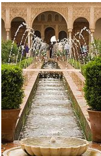
Obrázek 6: Palác Generalife

Sala de los Abencerrajes (Sín Abencerrajů) odvozuje název z legendy, podle které Boabdil, poslední král Granady, pozval vrchní představitele zmiňované skupiny na banket a nechal je pak na tom místě povraždit. Tato místnost je dokonalé náměstíčko s vysokými kopulemi zamřížovanými okny jako základna. Střecha je znamenitě zdobena modrou, hnědou, červenou a zlatou barvou. Sloupy podpírající ji a oblouky vyvěrající v úžasném stylu. Naproti tomuto sálu se nachází Sala de las dos Hermanas (Sál dvou sester), jež svůj název odvozuje z dvou velmi pěkných mramorových destiček, jež jsou součástí dláždění. Tyto destičky mají rozměry 50 na 22 cm a jsou bez jakéhokoliv poskvrnění. Uprostřed sálu je fontána a střecha – voštinová kopule s drobnými obrázky. Každý z obrázků je jiný a říká se že je jich na 5000 – což je skvělý příklad maurské stalaktitové klenby.