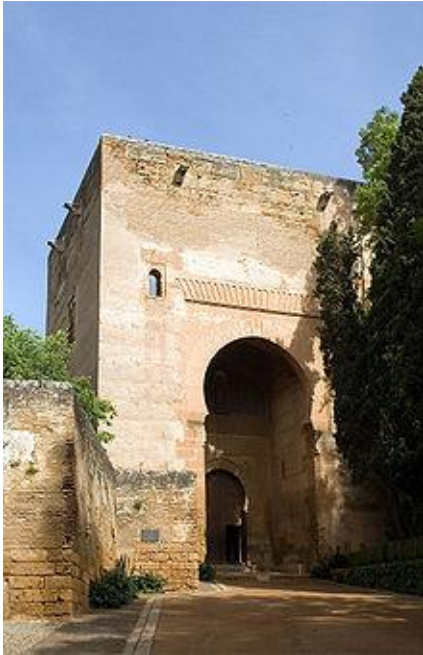
Obrázek 4: Věž spravedlnosti

Navzdory dlouhému období zanedbávání, úmyslného vandalismu a někdy i chybnému restaurování, kterým Alhambra prošla, zůstává stále nejkrásnějším příkladem maurského umění vrcholné evropské fáze. Oproštěna od přímého byzantského vlivu, který můžeme najít na kordóbské katedrále Mezquita, je komplexnější a fantastičtější než Giralda v Seville. Většina budov paláců má čtvercové půdorysy, se všemi místnostmi obrácenými do centrálního nádvoří. Celek dosáhl svých nynějších rozměrů jednoduše postupným přidáváním nových čtvercových půdorysů vyprojektovaných na stejném principu. Půdorysně se však liší rozměrem a jsou navzájem propojeny menšími místnostmi a průchody. Vnější vzhled je však strohý a prostý, jakoby tímto architekt zamýšlel zvýšit kontrast vůči interiéru. Tam je palác nedostižně nádherný ve svém detailu mramorových sloupů a arkád, stejně jako patinovaných stropů a jakoby zahalené průsvitnosti nezměrné štukatérské práce. Slunce a vítr má volný přístup a tak celý efekt má nádech lehkosti a ladnosti. Modrá, červená, a zlatavě žlutá jsou působením času poněkud znevýrazněny, avšak stále působivé.