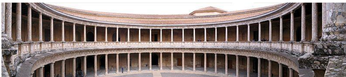
Obrázek 2: Terasa paláce Karla V

Plošina, která měří přibližně 740 m do délky a 250 m v nejširší části, zabírá asi 142 000 m 2 . Je obehnaná opevněnou zdí, jež je lemována třinácti věžemi. Řeka Darro vyvěrající z hluboké prolákliny na severu, odděluje území granadského Albaicinu; Údolí Assabica obsahující park Alhambra je situován západně a jižně a taktéž, mimo toto údolí, téměř paralelně s vyvýšeninou Monte Mauror. Toto údolí je hraničním prvkem oblasti Antequeruela.