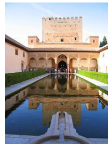
Obrázek 1: Alhambra

Alhambra (doslovně Rudý hrad, v arabštině الحمراء [Al Ḥamrā']) je středověký komplex paláců a pevností maurských panovníků Granady. Nachází se na území jižního Španělska (v době výstavby známé jako Al-Andalus). Zaujímá prostor kopcovité terasy na jihovýchodní hranici města Granady. V době nadvlády Islámské říše nad územím Španělska byla Alhambra mešitou, nyní však je muzeem skvostné islámské architektury. (1)